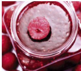
Lebensmittel- / Getränkeindustrie Mikrobiologie